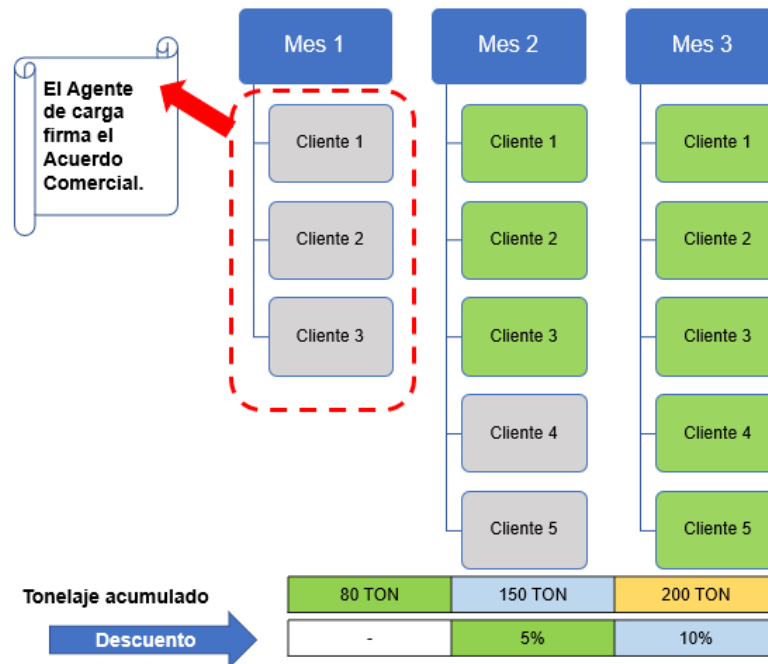
Gráfico 2. Acumulación de tonelaje para aplicación de la Política Comercial

Los descuentos serán otorgados a aquellos Usuarios que cumplan con los requisitos detallados dentro de la Política Comercial y no estarán obligados a aceptar dichos descuentos.